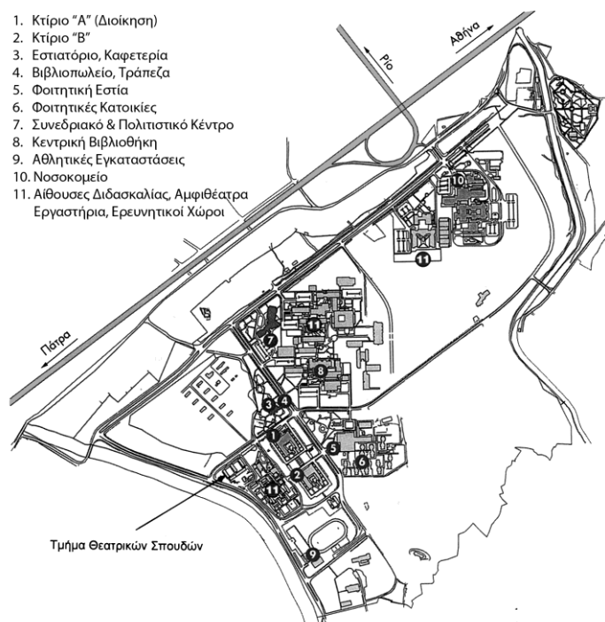
Σχεδιάγραμμα του Πανεπιστημίου Πατρών

Τα εγκαίνια της λειτουργίας του Πανεπιστημίου έγιναν στις 30 Νοεμβρίου 1966, εορτή του Αγίου Ανδρέου, Προστάτη της πόλεως των Πατρών. Ο Άγιος Ανδρέας, επί σταυρού σε σχήμα Χ, αποτελεί το έμβλημα του Ιδρύματος.