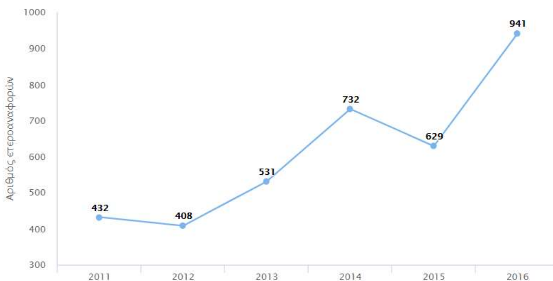
Σχήμα 5.4: Εξέλιξη Αριθμού ετεροαναφορών* Ετεροαναφορές

*(για όσα μέλη ΔΕΠ καταθέσαν απογραφικά δελτία για την περίοδο 2011-15)