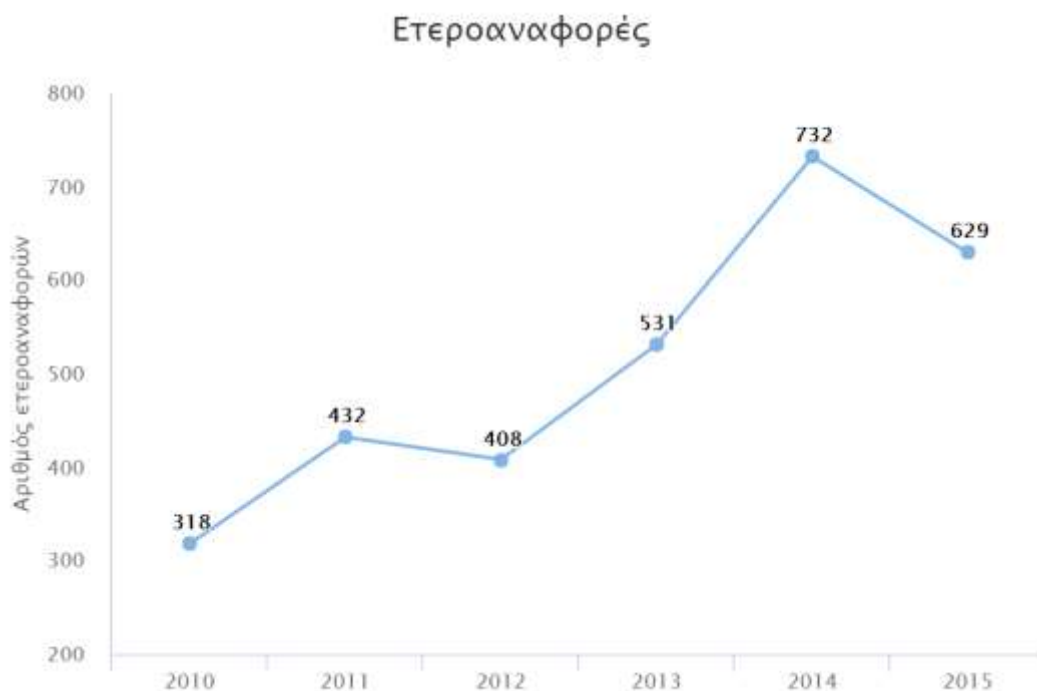
Σχήμα 5.4: Εξέλιξη Αριθμού ετεροαναφορών*

*(για όσα μέλη ΔΕΠ καταθέσαν απογραφικά δελτία για την περίοδο 2011-15)