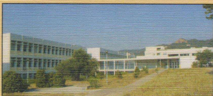
ΤΜΗΜΑ ΗΛΕΚΤΡΟΛΟΓΩΝ ΜΗΧΑΝΙΚΩΝ ΚΑΙ ΤΕΧΝΟΛΟΓΙΑΣ ΥΠΟΛΟΓΙΣΤΩΝ