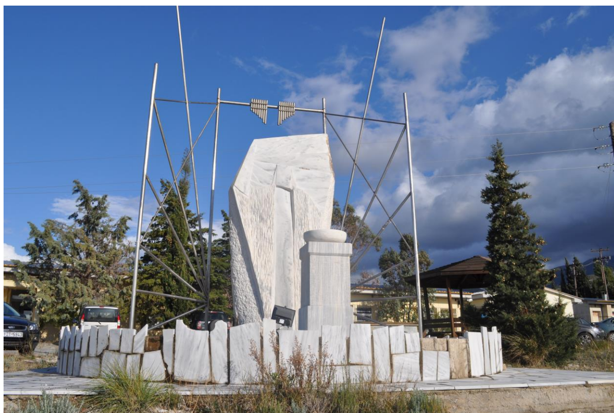
Εικ. 2 Μνημείο μπροστά στο κτίριο Α του Τμήματος

που σχετίζονται με τις θεατρικές σπουδές, ενώ τα διεθνή περιοδικά βρίσκονται στην κεντρική βιβλιοθήκη του Πανεπιστημίου. Το Τμήμα έχει πλήρως εξοπλισμένο υπολογιστικό κέντρο προς χρήση των φοιτητών του Τμήματος, καθώς και αίθουσα πολυμέσων και μία ταινιοθήκη. Οι περισσότερες αίθουσες διδασκαλίας διαθέτουν οπτικοακουστικό τεχνικό εξοπλισμό.