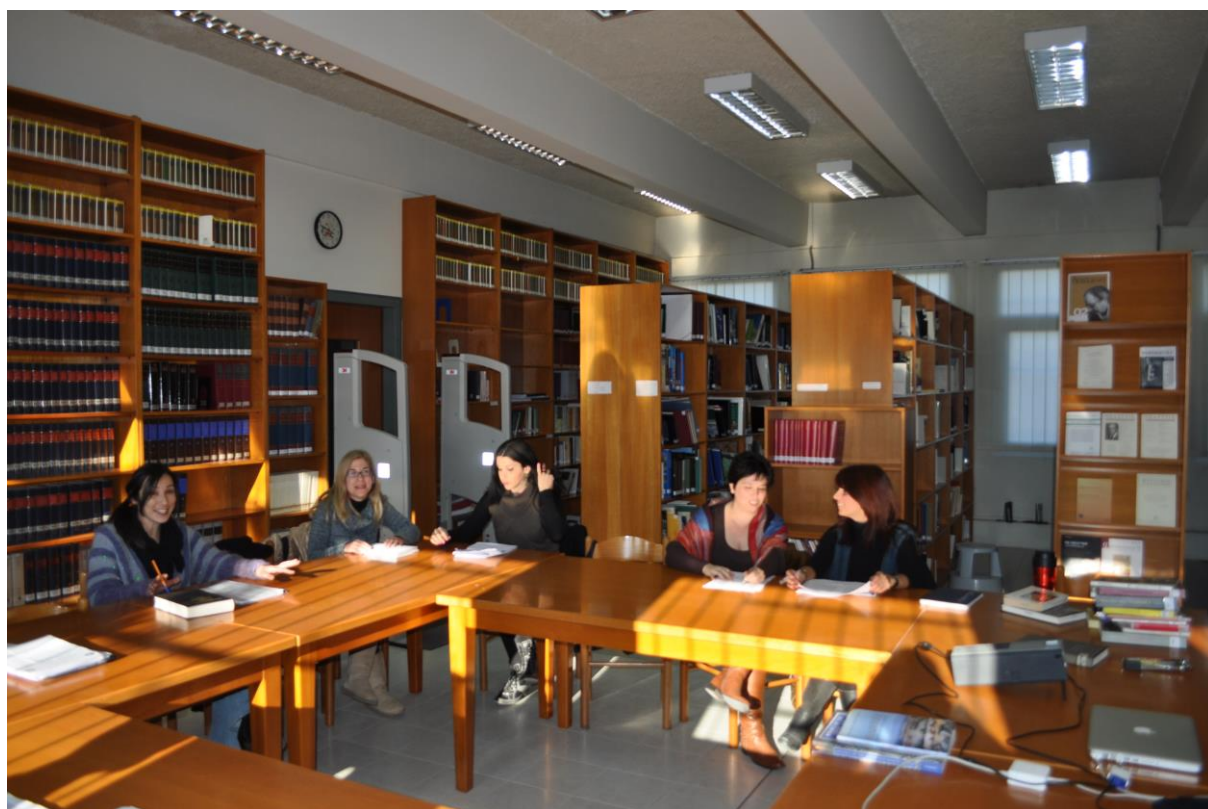
Εικ. 4 Μεταπτυχιακοί φοιτητές του Τμήματος πριν από μάθημα

Έχουν αναρτηθεί στο διαδίκτυο ως τώρα τριάντα εργασίες με θεματολογία από την Αρχαία Τραγωδία ως το Μίμο, την πρόσληψη του αρχαίου δράματος από νεότερους ποιητές, δραματουργούς, στη σκηνοθεσία, σκηνογραφία, και μελέτες για ειδικά ζητήματα όπως τη χρήση της χειρονομίας στο αρχαίο θέατρο.