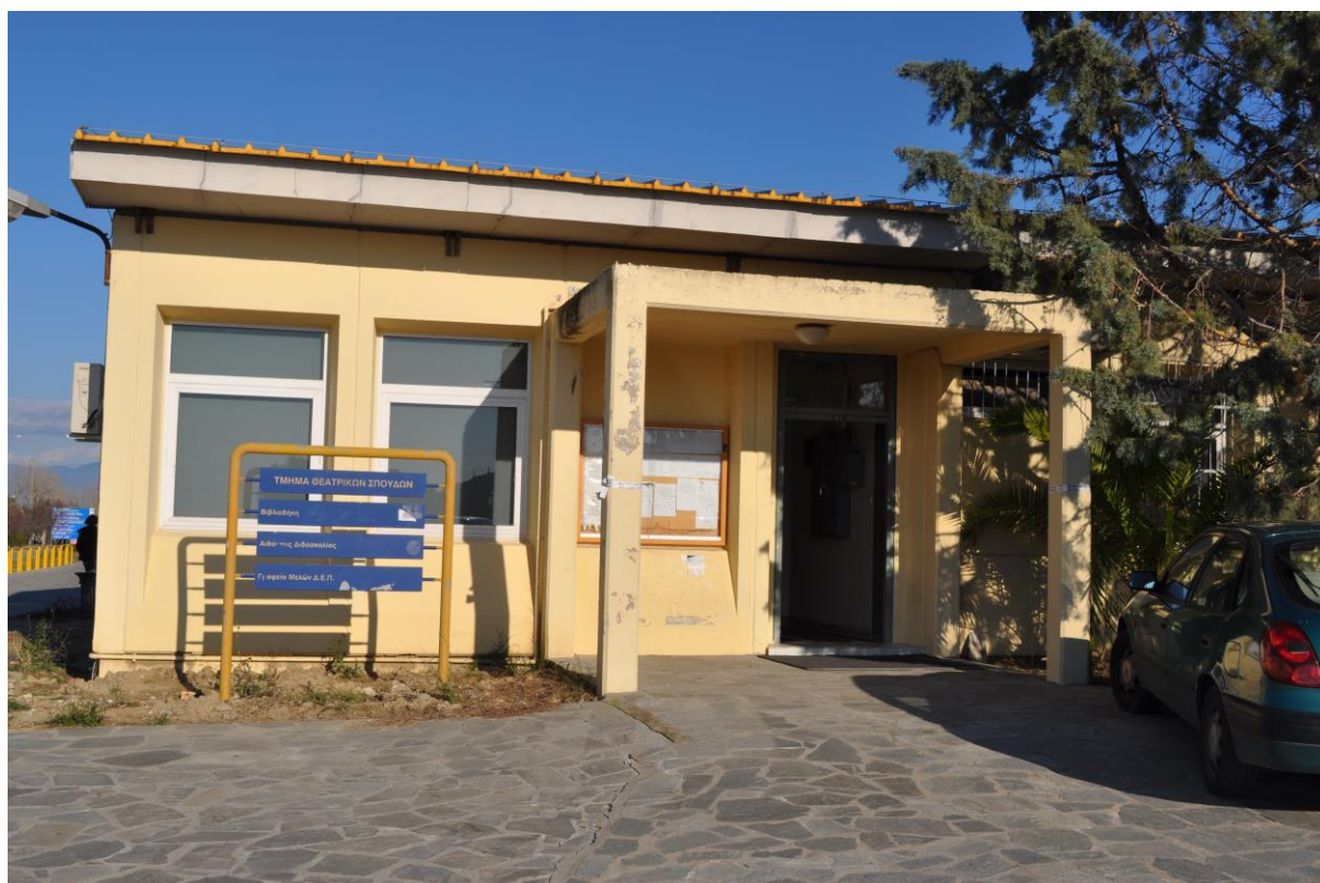
Εικ. 1 Το κτήριο Α του Τμήματος, κεντρική είσοδος

ΤΟ ΤΜΗΜΑ ΘΕΑΤΡΙΚΩΝ ΣΠΟΥΔΩΝ ΤΟΥ ΠΑΝΕΠΙΣΤΗΜΙΟΥ ΠΑΤΡΩΝ εδρεύει στην Πανεπιστημιούπολη του Ρίου, 7 χλμ. περίπου από την πόλη της Πάτρας. Το κτηριακό συγκρότημα του Τμήματος Θεατρικών Σπουδών περιλαμβάνει τέσσερα κτήρια, εκ των οποίων τα τρία είναι προκατασκευασμένα. Η περιοχή έχει αρκετό πράσινο με θέα το Παναχαϊκό όρος, τον Πατραϊκό κόλπο, τα βουνά της Στερεάς Ελλάδας και την κρεμαστή γέφυρα Ρίου-Αντιρρίου. Τα κτήρια του Τμήματος Θεατρικών Σπουδών βρίσκονται κοντά στο κτήριο Α της Πρυτανείας, όπως και σε αυτά των Τμημάτων Φιλολογίας, Παιδαγωγικού Δημοτικής Εκπαίδευσης, και Προσχολικής Εκπαίδευσης Νηπιαγωγών. Σε σχετικά κοντινή απόσταση, επίσης, βρίσκονται οι εγκαταστάσεις της κεντρικής βιβλιοθήκης του Πανεπιστημίου, του Πολιτιστικού και Συνεδριακού Κέντρου, καθώς του Πανεπιστημιακού Νοσοκομείου.