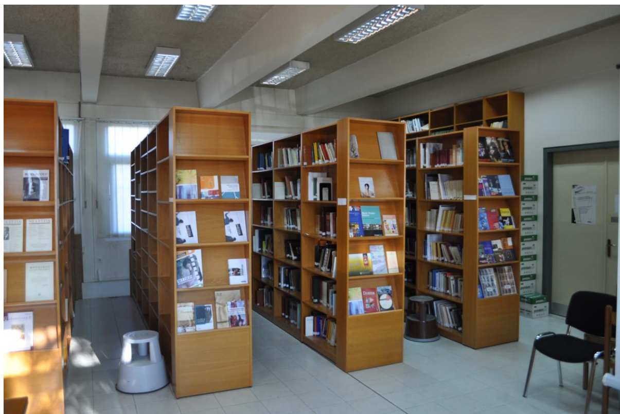
Εικ. 3 Μέρος της βιβλιοθήκης του Τμήματος στο κτίριο Α

Το Τμήμα έχει στη διάθεσή του πέντε (5) διοικητικούς υπαλλήλους καθώς και μία βιβλιοθηκονόμο. Μία από τις υπαλλήλους του κλάδου ΠΕ Διοικητικού-Οικονομικού τελεί χρέη Προϊσταμένης έως την οριστική στελέχωση της θέσης, άλλη μία ανήκει στον ίδιο κλάδο, και τρεις είναι του κλάδου ΔΕ Η/Υ. Η βιβλιοθηκονόμος κατέχει τους σχετικούς τίτλους σπουδών για τη διαχείριση μιας επιστημονικής βιβλιοθήκης με περισσότερους από 8000 τόμους.